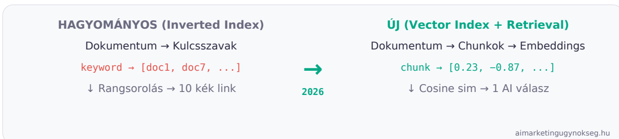
Ábra: Hagyományos inverted index vs. vektoros retrieval folyamat

A különbség méretes. A hagyományos SEO a crawlability-ről szól. A Vector Index Hygiene a retrieval readiness-ről. Ez a különbség dönti el, hogy megjelenél-e az AI válaszokban.