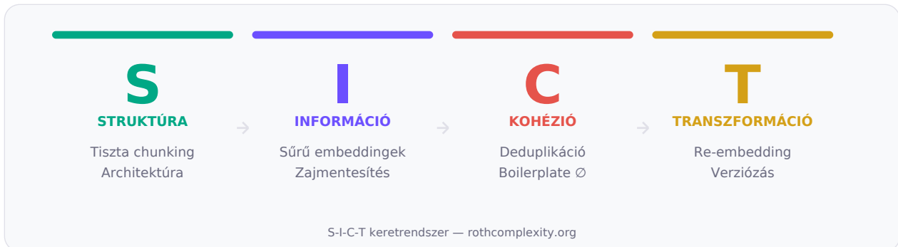
Ábra: S-I-C-T négy pillér – Vector Index Hygiene mapping

Az S-I-C-T keretrendszert Róth Miklós dolgozta ki a rothcomplexity.org-on, nem-egyensúlyi termodinamika és dinamikus rendszerek elmélete alapján. Négy univerzális funkcionális problémát old meg – tökéletesen illeszkedik a Vector Index Hygiene-re.